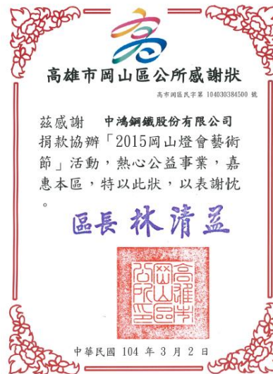
捐款協辦岡山燈會藝術節活動感謝狀