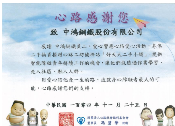
心路基金會感謝狀