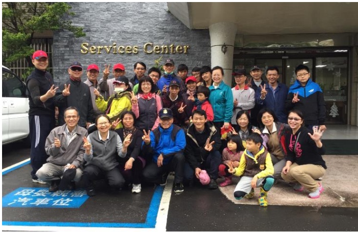
高雄市政府社會局仁愛之家服務志工合影