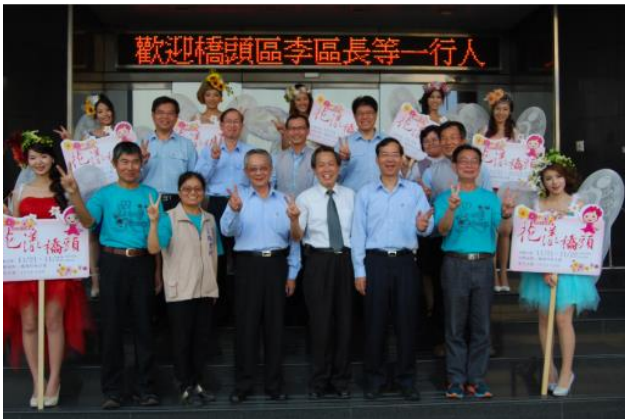
橋頭區花田喜事活動造勢宣傳