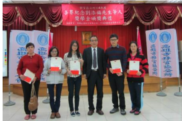
梓官區優秀學子獎學金頒獎表揚