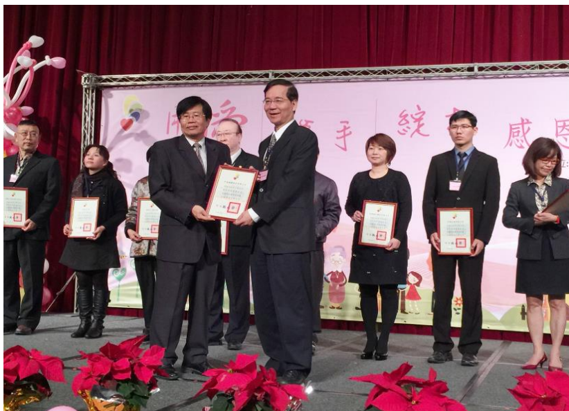
黃總經理(前右)代表接受高雄市政府致贈感謝狀

中鴻積極利用有限的資源條件，以其為社會資源作有效的發揮，秉持「生命」與「教育」為參與公益二大主軸原則，著重對社會「持續性」的影響，以長期投入、持續關懷的角度，讓中鴻的對社會的愛心與關心永續傳遞，中鴻持續長期贊助高雄市政府社會局「脫貧自立計畫」及高雄市大高雄生命線協會「自殺防治及推廣生命教育計畫」經費，長期對「脫貧自立計畫」的默默付出更受到高雄市政府的高度肯定，於105年1月26日公開表揚並頒發感謝狀。