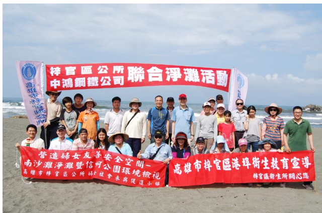
梓官區蚵寮南沙灘服務志工同仁合影

(3)梓官區蚵寮南沙灘淨灘：為推動環境永續的理念，於104年5月30日中鴻與鄰近的梓官區公所針對其所屬的蚵寮南沙灘，共同推動聯合淨灘活動，中鴻由總經理帶領22位志工同仁與親友一同參加。此處沙灘鄰近梓官區蚵仔寮漁港，近年來市府進行觀光漁港改造、信蚵公園設立等建設，已成為觀光遊憩的休閒景點，本次淨灘由梓官區蔣區長與中鴻總經理親自到場與同仁身體力行清理沙灘垃圾，淨灘活動使志工同仁透過實際行動表達對環境的關懷，並傳達本公司永續環境的理念，更樹立企業與地方政府共同維護生態環境合作模式。