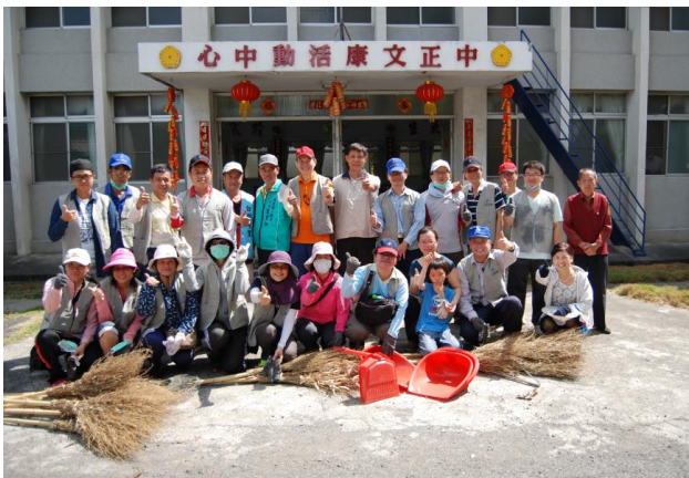
橋頭區白樹里精忠新村服務志工合影

白樹里精忠新村屬行政院國軍退除役官兵輔導委員會協助維護傳統式眷村，因人口嚴重外移，故社區居民大多為年齡偏長的榮民及其眷屬，透過中鴻的志工同仁的服務，協助其環境的清掃、清理孳生蚊蟲的器皿及水溝、移除或修剪危害建物或有安全之虞之樹木與植栽、清運大型家俱及廢棄物，幫助居民清理長期累積或平時較難處理的垃圾，以維護社區環境安全與居民的健康，透過親切的服務與深入的接觸，獲得當地居民的感激與讚賞，以實際的行動，使公司企業形象再次獲得鄰里間的肯定。