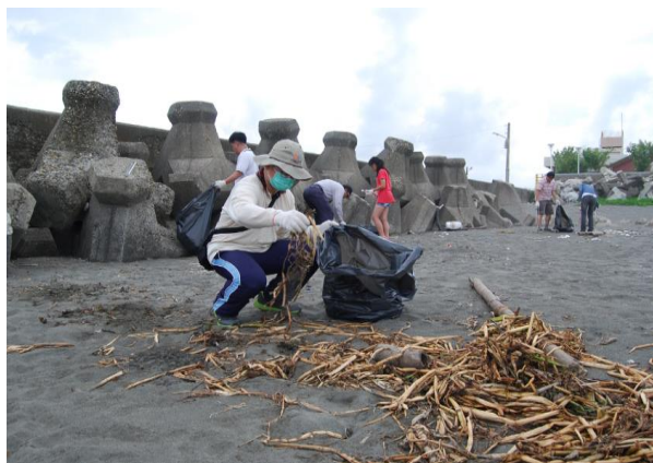
志工同仁進行沙灘垃圾清理

3.愛心物資捐贈：中鴻結合「心路社會福利基金會」幫助弱勢、愛物惜物的環保精神，2012年起已持續4年於全公司發起募集愛心二手物品捐贈心路工坊之活動，透過公司作為募集與運送的平台，募集同仁家中堪用的物品，經心路工坊障礙青年的巧手整理後，在心路工坊楠梓站的「好天天二手小舖」中上架販售或於各園遊會活動現場義賣，實踐資源循環再利用的環保概念，傳遞同仁愛心，更提供心智障礙青年持續的工作機會，給智能障礙者一份幸福的作業時光，在長期推動下同仁紛紛響應，2015年已擴大為不限期間的長期性募集，募集物品更達到歷年來最多的數量，未來將持續募集同仁的愛心物資，使同仁的愛心更不受空間與時間的限制，以發揮更大的募集效益，期望能幫助更多的心智障礙家庭與孩子走入社會。