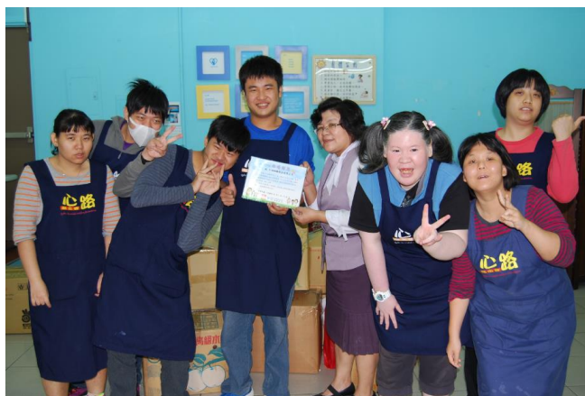
愛心物資送達與心路工坊青年合影

3.愛心物資捐贈：中鴻結合「心路社會福利基金會」幫助弱勢、愛物惜物的環保精神，2012年起已持續4年於全公司發起募集愛心二手物品捐贈心路工坊之活動，透過公司作為募集與運送的平台，募集同仁家中堪用的物品，經心路工坊障礙青年的巧手整理後，在心路工坊楠梓站的「好天天二手小舖」中上架販售或於各園遊會活動現場義賣，實踐資源循環再利用的環保概念，傳遞同仁愛心，更提供心智障礙青年持續的工作機會，給智能障礙者一份幸福的作業時光，在長期推動下同仁紛紛響應，2015年已擴大為不限期間的長期性募集，募集物品更達到歷年來最多的數量，未來將持續募集同仁的愛心物資，使同仁的愛心更不受空間與時間的限制，以發揮更大的募集效益，期望能幫助更多的心智障礙家庭與孩子走入社會。