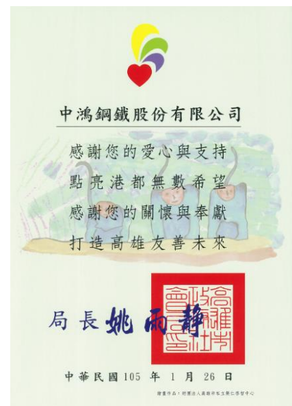
高雄市政府社會局感謝狀