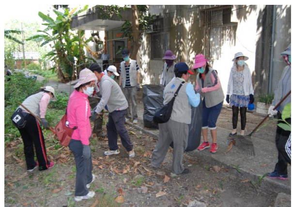
志工進行環境清掃與維護