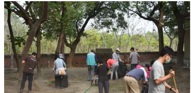
志工進行環境清潔