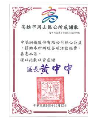
岡山區公所感謝狀