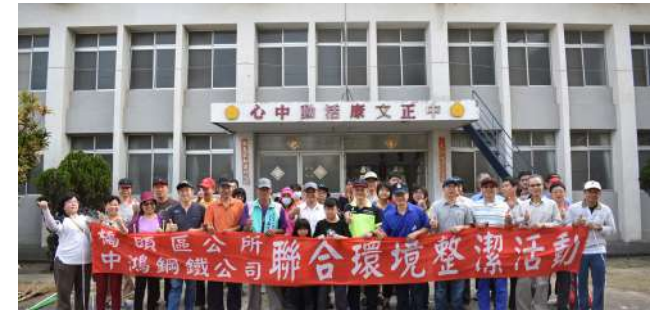
參與環境整潔活動志工合照

基於幫助弱勢、愛物惜物的環保精神，中鴻自 2012 年起每年舉辦二手物品募捐活動，呼籲同仁響應資源再生捐贈活動，把家中用不到的東西捐贈出來給心路基金會楠梓心路工坊。讓這些資源發揮更多的價值，幫助需要照顧的人，回饋社會。