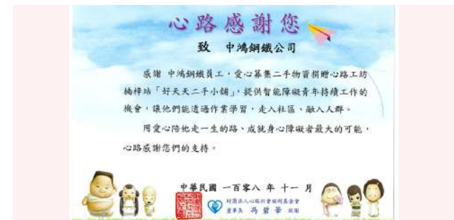
心路基金會感謝狀