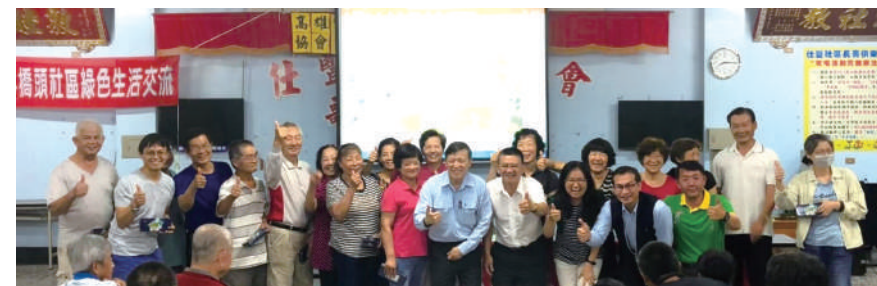
橋頭社區綠色生活交流