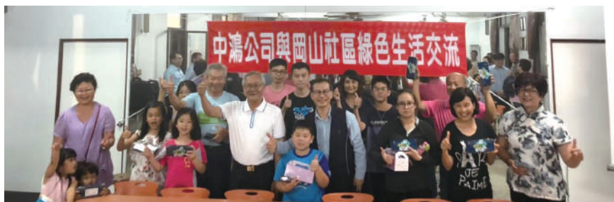
岡山社區綠色生活交流

中鴻身為社區一份子，我們積極與社區互動交流，以「綠色生活推動」、「交通安全」、「健康促進」等不同主題循環的模式，每年至橋頭、梓官、岡山等社區舉辦交流活動，從2016年的「綠色生活推動」主題開始，接續2017年為「交通安全」，與社區居民分享交通安全知識，2018年則是以「健康促進」為主題，在3~5月期間共辦理6個場次的社區交流活動。2019年再度以綠色生活為主題，將環境保護的觀念由公司內部擴展至鄰近社區。