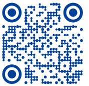
中鴻企業永續專區