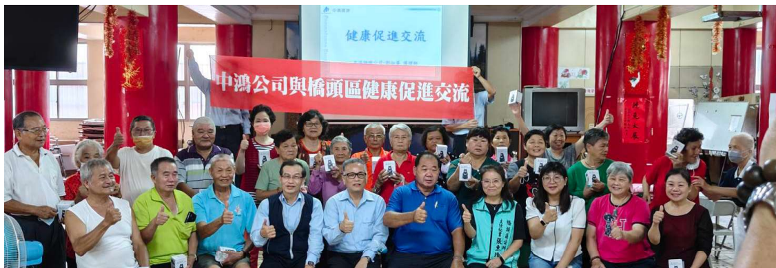
橋頭社區健康促進交流活動

除上述管理措施外，中鴻亦積極與社區互動交流，從2016年開始，每年以「交通安全」、「健康促進」等不同主題循環的模式，至橋頭、梓官、岡山等社區舉辦交流活動。2023年以健康促進為主題，舉辦合計6場社區交流活動，與鄰近社區民眾進行交流，累計參與民眾達1,750人次(以發放贈品數量預估)。