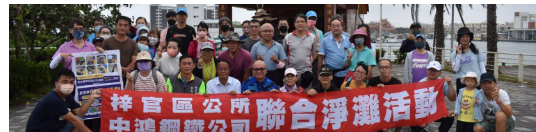
參與淨灘活動志工合照