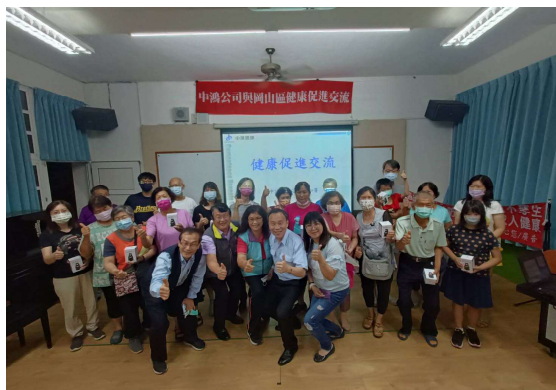
岡山社區健康促進交流活動