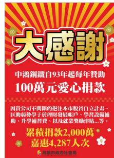
高雄市政府社會局脫貧自立計畫感謝狀

中鴻認同高雄市政府社會局「脫貧自立計畫」的理念及其執行策略，自 2004 年起，每年捐贈 100 萬元，累計贊助金額達 2,000 萬元。其執行策略包括理財、身心、學習、環境、就業等五大面向，從各方面協助累積家戶脫貧能量，其中 2023 年中鴻所贊助的專案項目有：「夢翔啟動-青年自立計畫」、「存新當young 青年自立計畫」、「升學補習費暨學習設備補助」、「脫貧加倍佳-大專青年就業協助方案」等，透過培養自我實現能力、職涯探索、理財觀念、社區志願服務等課程，協助弱勢家庭子女內外自我成長與充實，達到自立脫貧的目標。