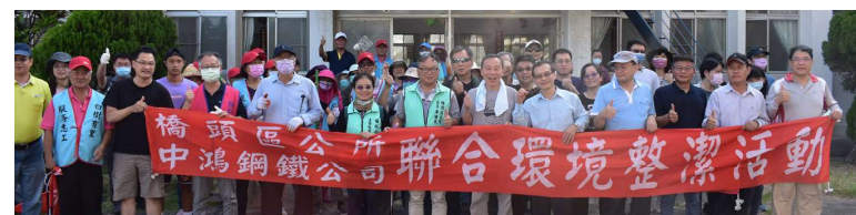
精忠新村聯合環境整潔活動志工合照