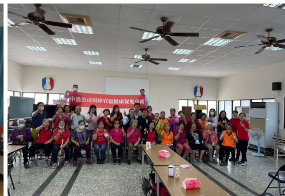
梓官社區健康促進交流活動