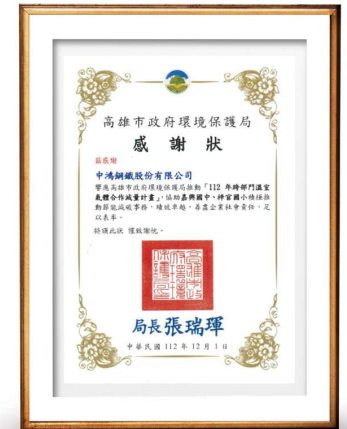
跨部門溫室氣體合作減量計畫感謝狀