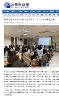
夢翔啟動 - 青年自立計畫成果報導