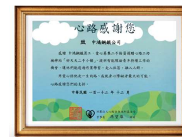
心路基金會感謝狀

基於幫助弱勢、愛物惜物的環保精神，中鴻自 2012 年起，連續 12 年舉辦二手物品募捐活動，呼籲同仁響應資源再生捐贈活動，把家中用不到的東西捐贈出來給心路基金會楠梓心路工坊。讓這些資源發揮更多的價值，幫助需要照顧的人，回饋社會。2023 年捐贈物資約達 59 個 90cm 郵信箱，累積捐贈物資達 598 個 90cm 郵信箱(2012 年~2021 年捐贈物資數量，因當時未實際量測，故均以 2022 年實績推估)。