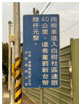
橋頭區白樹路與合興街路口告示牌

本公司熱軋廠與冷軋廠分別位於高雄市岡山區及橋頭區，由於兩者均非座落於工業區內，導致運輸原料及產品時，拖板車會行經鄰近社區道路，預期會對當地社區居民帶來交通安全與車輛廢氣空汙之風險。故中鴻於設廠之初即邀請協力車行與當地社區里長、區公所、交通隊等利害關係單位共同協商、確立行車動線，制定「鋼品裝運安全管理辦法」，明確要求協力車行司機必須遵守行車動線、裝載規定及明訂相關罰則，並每年定期檢視相關規定，以消弭交通安全風險。另為降減車輛廢氣空汙風險，中鴻亦持續向協力車行宣導，使用環保4期以上車輛承載本公司鋼品。2023年承載車輛無發生重大交通事故，使用環保4期以上車輛比率達98%，亦無地區居民提出相關申訴。